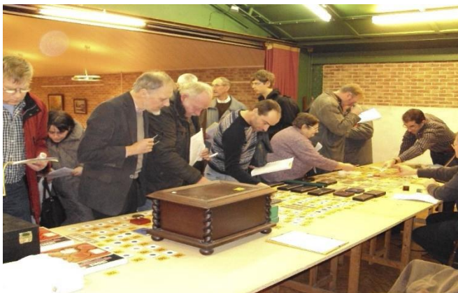
Belangstelling€ voor€ de€ Nieuwjaarsveiling€ van€ zaterdag€ 3€ januari€ 2015€