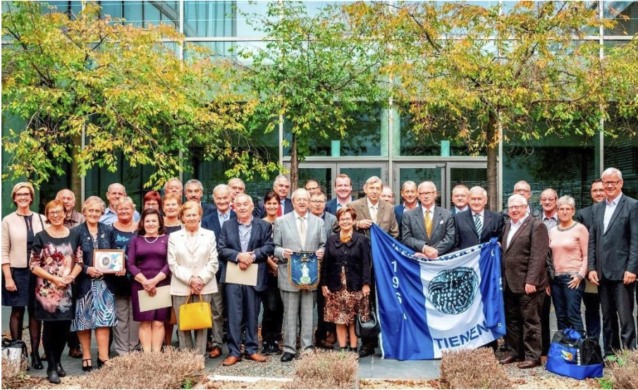
De negen verenigingen samen met alle gedeputeerden van de Provincie Vlaams Brabant. Gouverneur De Witte staat uiterst rechts op de foto.