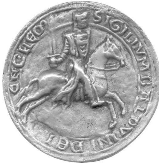
Medaille Sn 68,6 mm uitgegeven in 1980 ter gelegenheid van 900 jaar stad Izegem naar een zegel van Boudewijn II van Vlaanderen. Dit is het model, gebruikt voor de jaarpenning 2012 opgedragen aan Joris Frederickx, auteur van het Schoolproject

Tekst Urbain Hautekeete