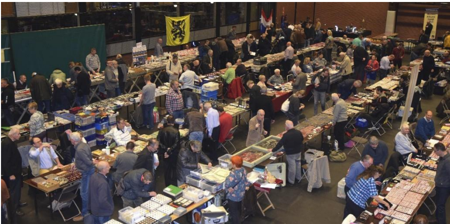
Afb. 1 - Sfeerbeeld van een Coin Event